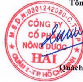
Quách Thành Đồng