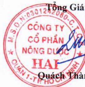
Quách Thành Đồng